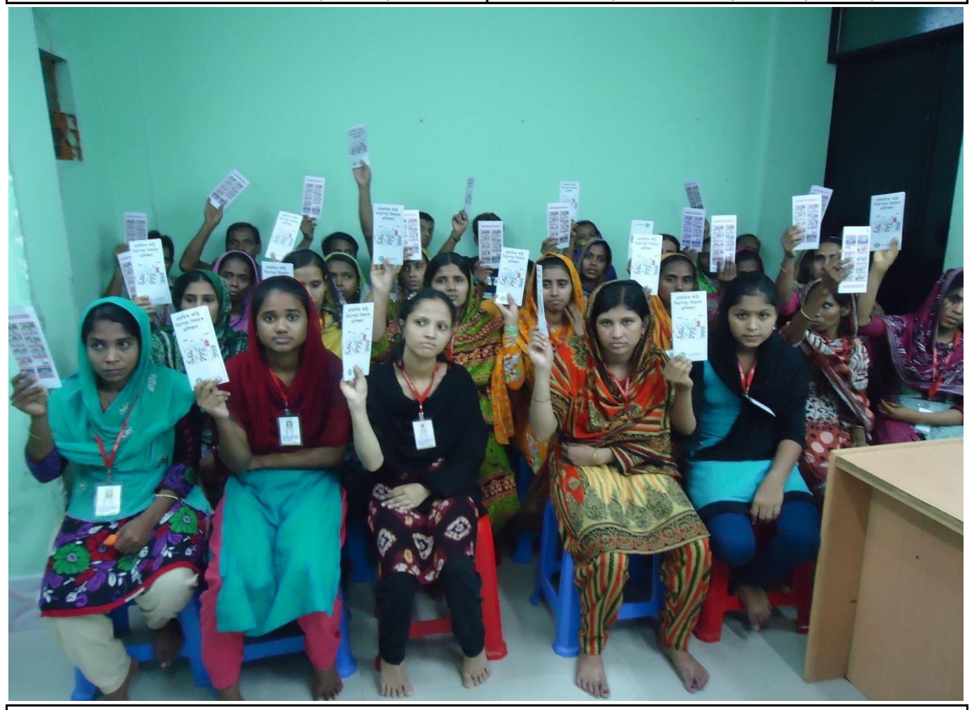
9.Leaflet and Helpline Card Distribution to the participant