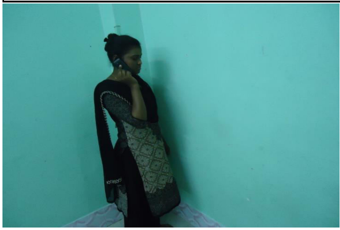
5. Helpline (Role play) Done by participants