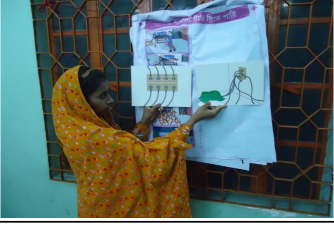
4.Make the difference activities done by Participants